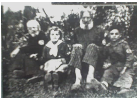
ANAUE, outubro de 1937.

Abaixo a foto nos mostra a idéia de que o ideal difundido pelo partido do sigma era forte e obtinha sucesso ao serem transmitidas de gerações para gerações.